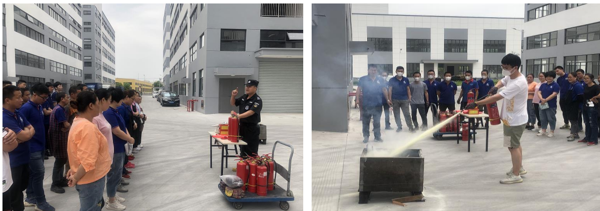
图 6.3-01 公司应急演练现场

公司每年举行消防演练和各种灾害应急演练。公司制订了《危险源辨识、风险评价和风险控制策划程序》、多个专项和综合应急预案等，如对火灾、洪水、台风、断电等均有相应的应急措施，并成立了应急指挥部和办公室。