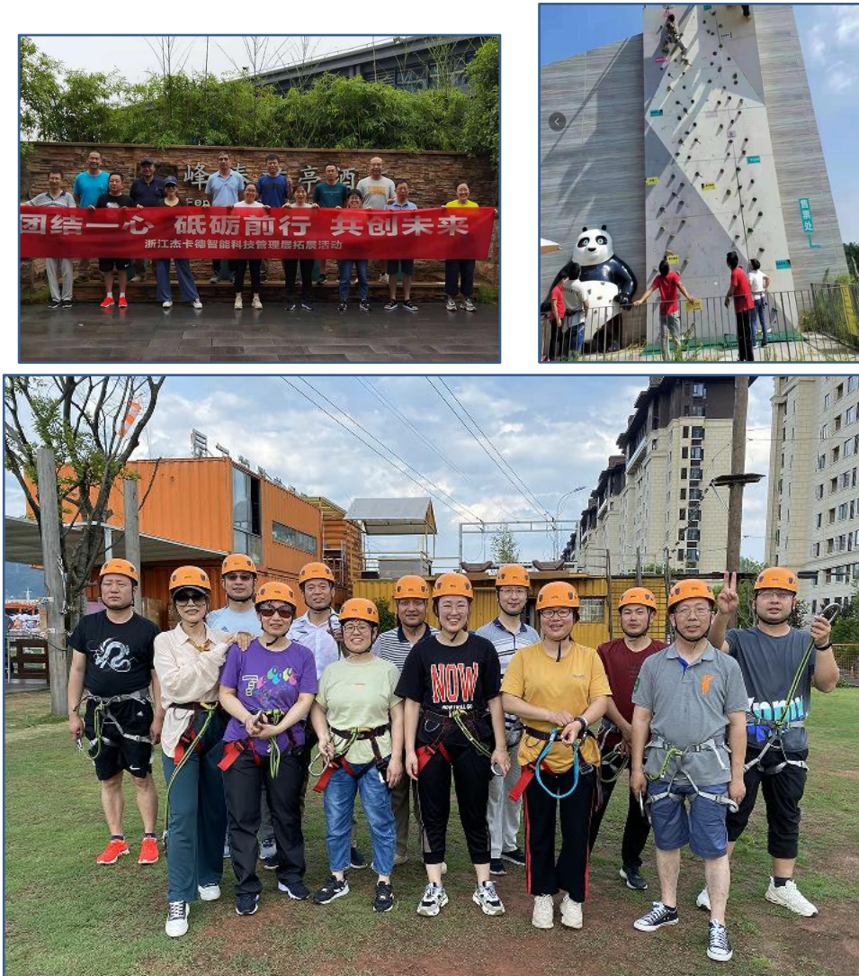
图 3.2.3-2 营造团队合作、温馨的企业文化

公司将五木科技的价值观、战略目标及业务战略编制成《公司章程》，使之成为公司每位员工必须知晓和遵守的“公司宪法”，涵盖了公司宗旨、基本经营政策、基本组织政策、基本人力资源政策、基本管理控制政策等内容。本着持续改进、民主决策的理念，《公司章程》每五年修订一次，由公司各层级优秀员工与董事会共同商议讨论并审核通过，确保宪章内容的合理性和实用性，提高企业文化执行力。