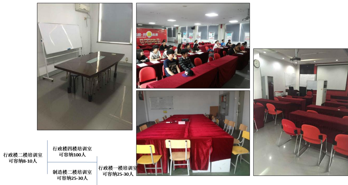
图 3.2-1 五木科技培训教室配套

对员工进行诚信教育。公司将员工学习和发展视为“投资”，把创建学习型组织，营造全员学习的氛围作为公司长期发展战略的重要组成部分。随着公司规模扩大和全球化发展战略的实施，公司将员工培训工作提到了议事日程，短期培训班已不适应公司发展的要求，公司急需对全体员工进行有计划、系统地进行培训，以提高员工的整体素质，公司成立了“五木科技商学院”，见图 3.2-1 教室配套。